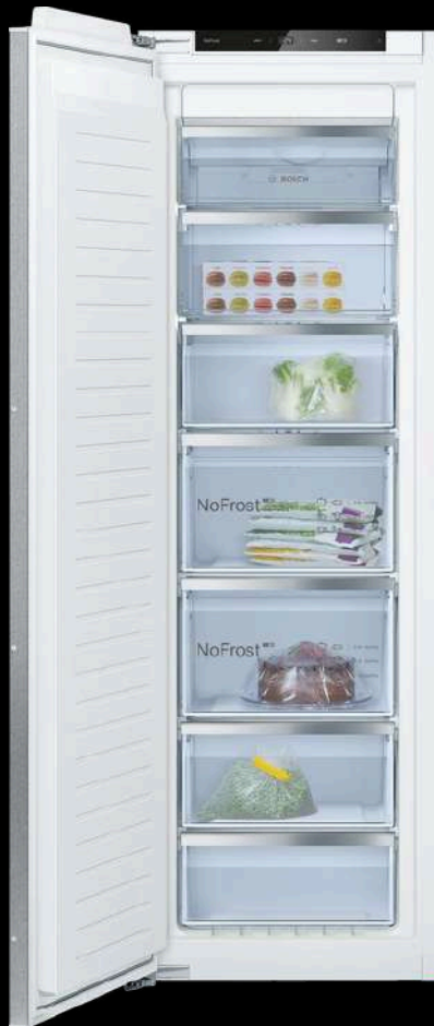
CONGELADOR INTEGRABLE 177.2 X 55.8 CM GIN81ACEO BOSCH