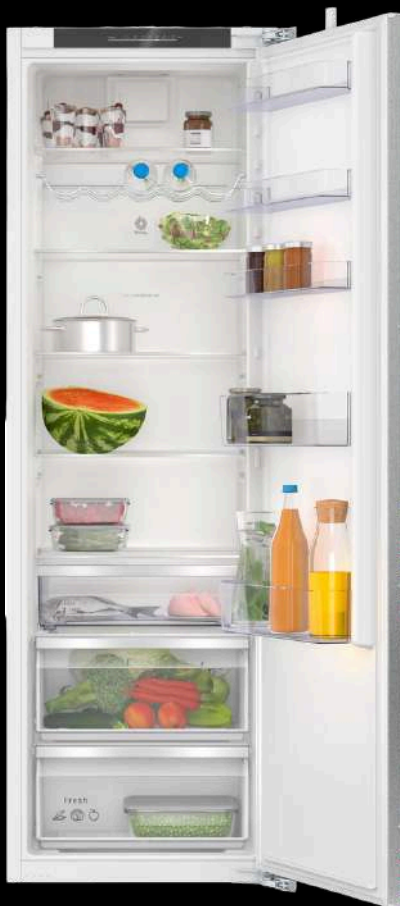
FRIGORÍFICO 1 PUERTA INTEGRABLE 177.2 X 55.8 CM 3FID737S BALAY

Como contra, si necesitas almacenar mucho congelado, se quedará corto. En diseño funciona muy bien: el conservador puede integrarse como pieza principal y el congelador esconderse con facilidad, casi como un actor secundario que no necesita foco.