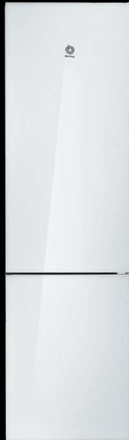
FRIGORÍFICO COMBI 203 X 60 CM 3KFC869BI BALAY