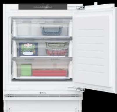
CONGELADOR INTEGRABLE BAJO ENCIMERA 82 X 59.8 CM 3GUE033F BALAY