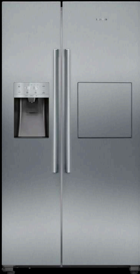
FRIGORÍFICO AMERICANO 178.7 X 90.8 CM KA93GAIDP SIEMENS